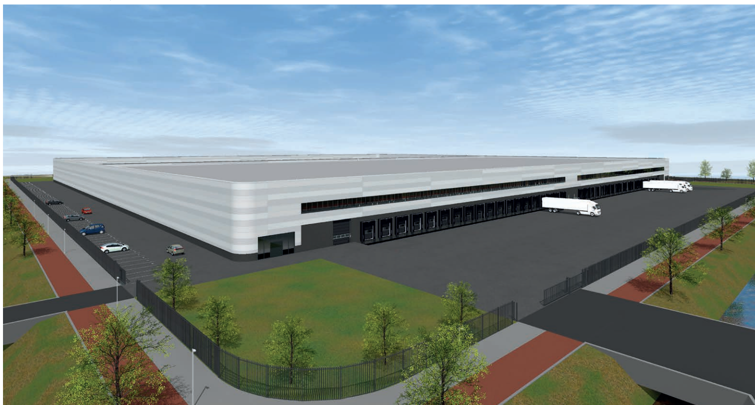
Schiphol Trade Park

Somerset is specialist in het ontwikkelen van hoogwaardig en grootschalig vastgoed op strategische - en multimodale locaties, met een duidelijke focus op logistiek en datacenters. Inmiddels heeft Somerset in Nederland ca. 400.000 m 2 aan distributiecentra ontwikkeld op daartoe verworven grondposities.