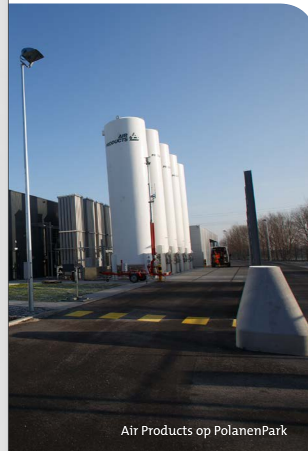
Air Products op PolanenPark

“Er is een goede toekomst voor dit bedrijventerrein. Het bevalt ons hier erg goed. Het bedrijventerrein is ruimtelijk en uitstekend bereikbaar.”