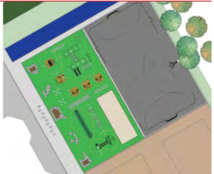
Plattegrond sporthal en sportplein