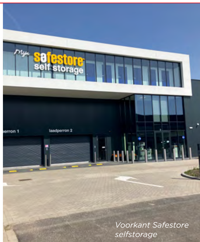
Voorkant Safestore selfstorage

Het gebouw is op meerdere vlakken duurzaam. Het hout heeft een speciaal FSC-keurmerk (internationaal keurmerk voor papier en hout), de lampen zijn LED, en er zijn geen bouwmaterialen gebruikt die slecht zijn voor het milieu. De stenen en gipsplaten zijn ook nog eens herbruikbaar. Ook komt er een groene tuin rondom het gebouw.