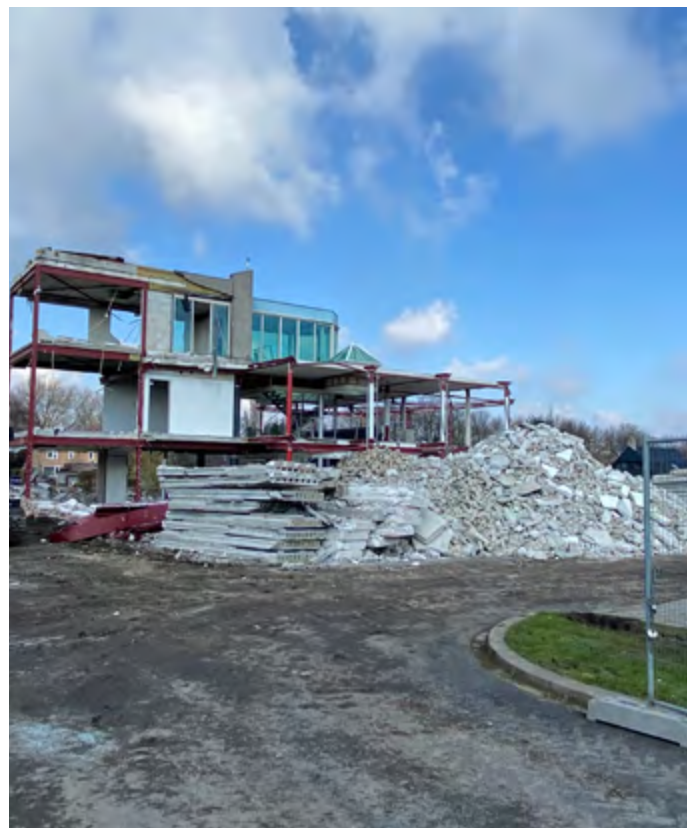
Sloop van het oude GPAG kantoor aan de Thailandlaan

De intentie van Topgeschenken is om in september 2024 te beginnen met bouwen. •