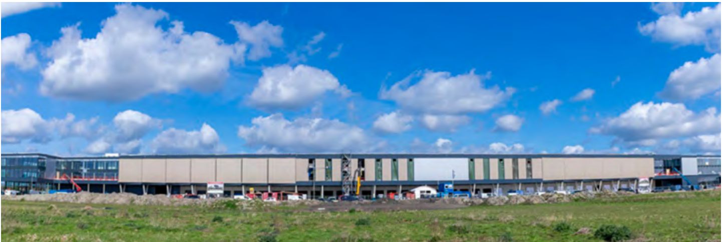
Green Square Logistics II-III

De oplevering van deze twee hoofdkantoren staat gepland voor juli/ augustus 2024. •